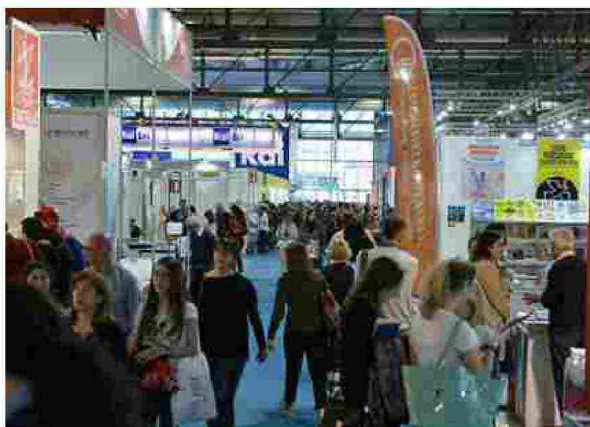
Tempo di Libri

Tempo di Libri: presentata oggi la seconda edizione della Fiera internazionale dell'editoria